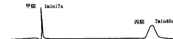
图1 甲烷柱混合标准气相色谱图 甲烷（1.28 min）；丙烷（7.67 min）